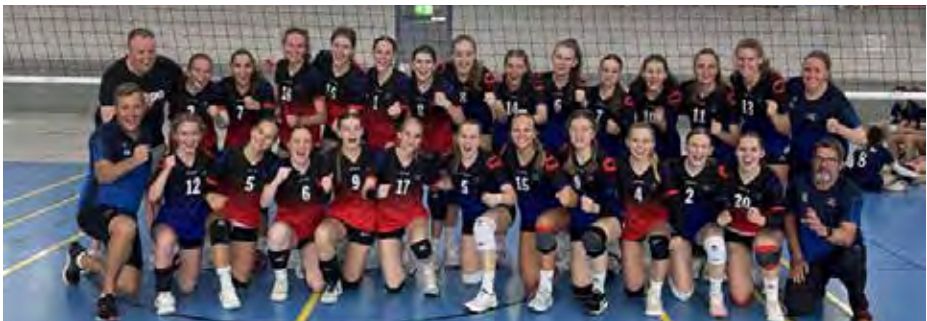
Die U20-weiblich- gewann die Regionsmeisterschaft unter dem Namen VC Osnabrück.